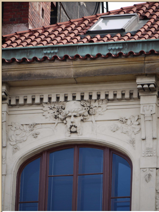
Stav v roce 2017